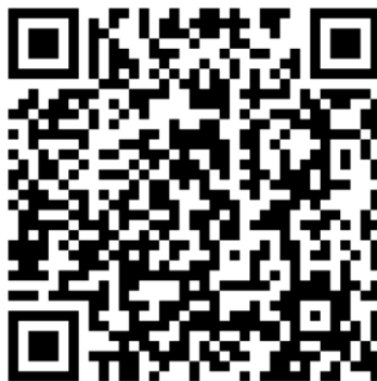
Рисунок 1. Приложения к статье «Использование технологии развития критического мышления в воспитательной работе учителя»